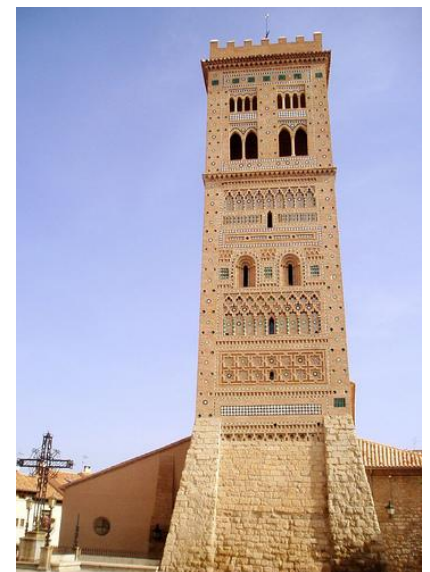
San Martín (Teruel)